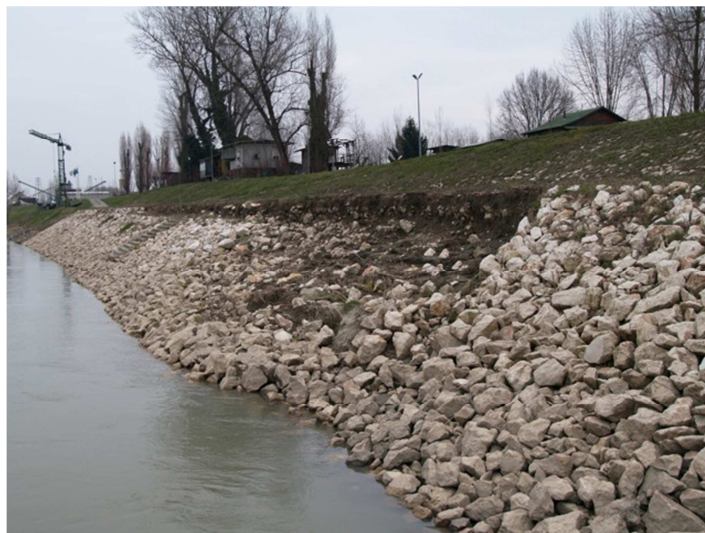
Figura 3: Difesa idraulica da ripristinare

L'intervento comprende inoltre la sistemazione della difesa in sponda destra di Po in corrispondenza della confluenza. In questo tratto infatti il filone d'acqua principale del fiume Po scorre a ridosso della sponda protetta da una difesa in massi con la duplice funzione di difesa idraulica e di opera di regolazione. A causa dell'azione erosiva esercitata dalle acque, la funzionalità della difesa è stata compromessa da una frana che ha determinato lo scivolamento verso l'alveo dei massi di rivestimento (Figura 3): risulta pertanto necessario, per assicurare la necessaria protezione ai territori retrostanti e al corpo arginale, procedere al ripristino dell'opera idraulica.