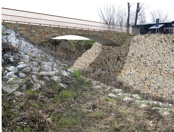
Figura 2: Rendering del nuovo ponte

Pertanto, il progetto redatto prevede la demolizione del ponte esistente e la costruzione di una nuova struttura simile nella forma a quella precedente ma, al contempo, in grado di offrire minori resistenze alle correnti d'acqua e buone garanzie di durata mediante l'impiego di materiali durevoli e resistenti ai cicli gelo/disgelo (Figura 2).